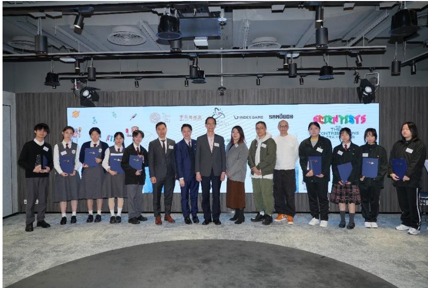
一眾嘉賓與比賽獲冠、亞及季軍隊伍的同學們合照。